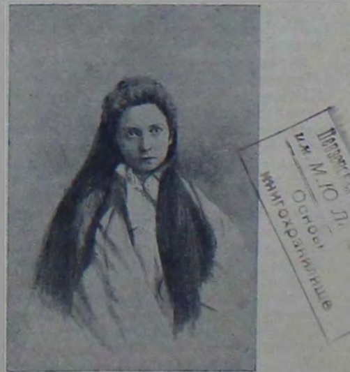
„Чайка“, дѣйствіе I-е.

Кажется, Ю. Д. Бѣляевъ,—въ то время (лѣтъ 10 назадъ) еще начинающій рецензентъ,—выразился про В. Ф. Коммисаржевскую, что она пришла къ намъ «принцессой кочующей и бѣдной». Это очень красиво сказано, но едва-ли вѣрно. Когда я увидѣлъ впервые В. Ф. Коммисаржевскую на сценѣ Александринскаго театра, мнѣ показалось, что у нея было уже немало актерскаго багажа. Мнѣ указывали, что