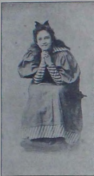
Рози. „Вой бабочекъ“, 1 дѣйств.