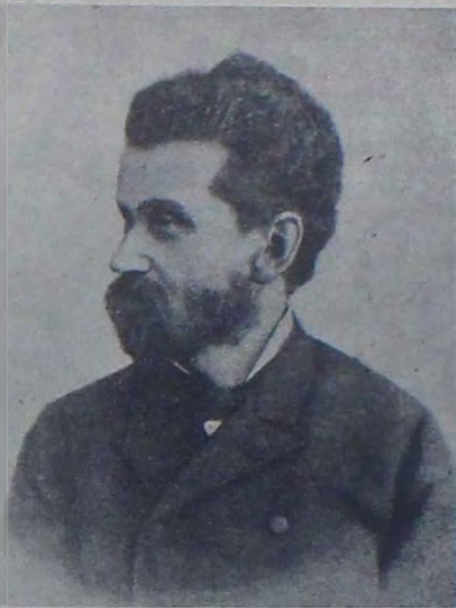
Э. Ф. Направникъ.

Кіевъ. Снятый было съ репертуара театра „Соловцовъ“, по распоряженію мѣстной администраціи, „Король“ Юшкевича, по ходатайству дирекціи театра, разрѣшенъ, наконецъ, къ постановкѣ.