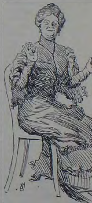
«Казенная квартира» Вихляева (г-жа Корчагина) Рис. М. Слѣпьяна.

Само собою понятно, что, при такой организаціи, гонораръ авторовъ, очень великъ. Въ смыслѣ авторскаго гонорара, всѣ парижскіе и провинціальныя театры раздѣляются на двѣ группы: «théâtres classés» и «théâtres non classés». Разница между этими двумя группами та, что первые (къ которымъ относятся наиболѣе крупныя театры) уплачиваютъ въ общество отъ 10% до 12% валового сбора; вторые же уплачиваютъ извѣстный % (обыкновенно 8%) валового сбора, обязаны платить извѣстный minimum (30 франковъ). Изъ первой группы исключенія составляютъ: Grand-Opéra, платящая 8% сбора (что при сборахъ оперы, въ 20000 фр. составляетъ 1600 фр. за вечеръ) и «Comédie Française», Одеонъ и Комическая Опера — платящие 15% сбора. Контроль здѣсь вполне обезпеченъ, такъ какъ кромѣ 12% въ общество, театры платятъ еще 11% въ пользу Assistance Publique (благотворительный сборъ). Сверхъ этихъ 12% авторы получаютъ еще на каж-