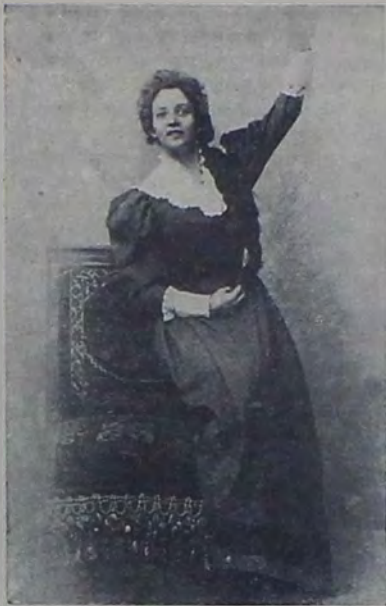
Клерхень. „Гибель Содома“.