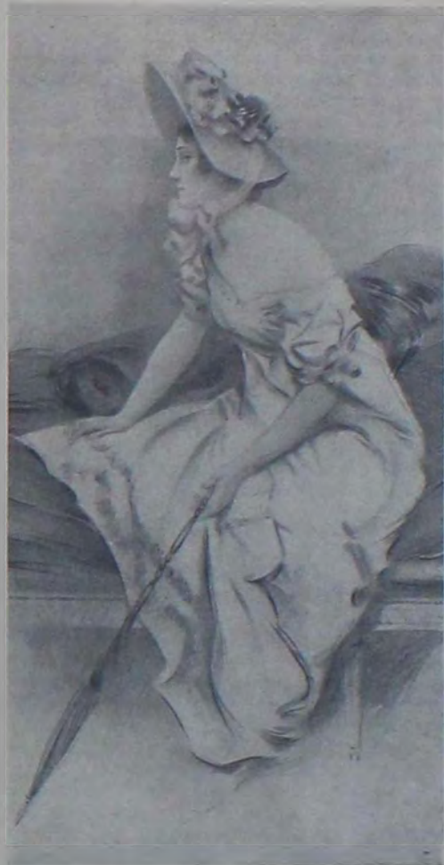
Изъ англійскихъ иллюстрацій къ моднымъ пьесамъ „Напрасный страхъ“.

Толпа, которая ищетъ художественныхъ наслажденій, которая идетъ наслаждаться художественными зрѣлищами, которая опредѣляетъ успѣхъ художественныхъ произведеній — такая толпа и можетъ быть условно названа «художественной»; особенно ея