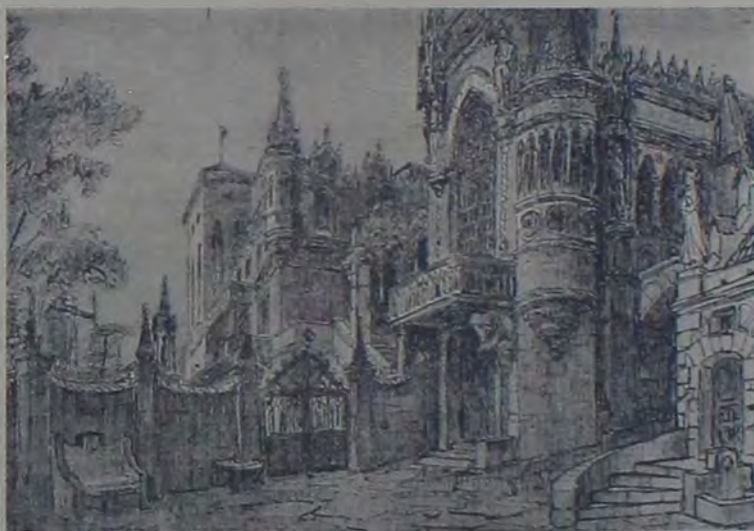
Эскизъ декораціи „Двѣнадцатая ночь“.