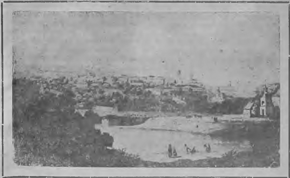
Вид гор. Пензы в середине XIX века.

ная в Педагогический техникум), в 1875 г.—землемерное училище (теперь Землеустроительный техникум). В 1881 году открыто реальное училище; при открытии его определенно писали, что реальное училище открывается для подготовки юношей в специальные высшие технические учебные заведения, так как „постепенно идущее вперед развитие промышленности в губернии создало потребность в специальных познаниях“.