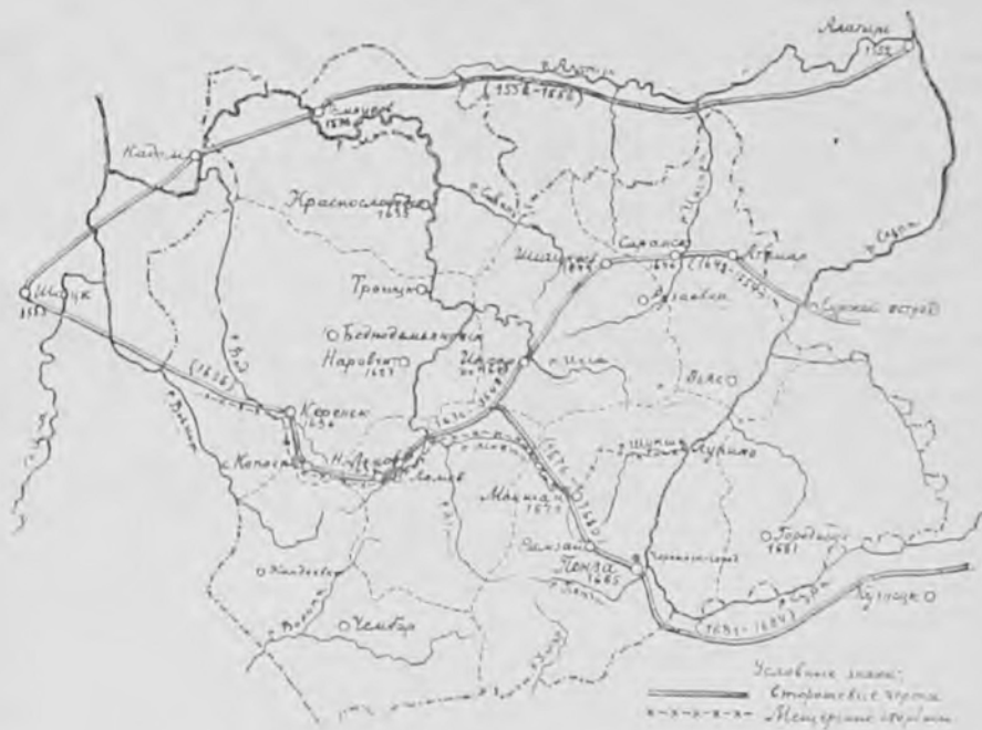
Карта № 9.