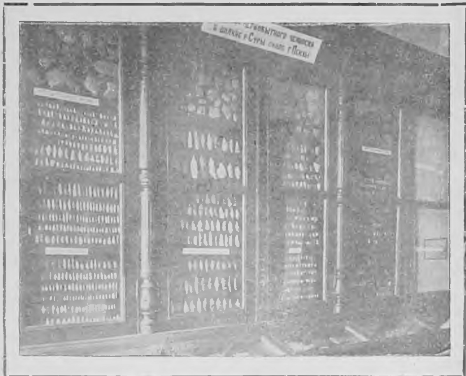
Орудия первобытного человека со стоянки около г. Пензы.

тало в бассейне р. Суры, племя Мокши—в бассейне р. Мокши. Огромные леса, расположенные в местности занятой мордвою, предрасполагали население к определенным занятиям. Мордва занималась бортничеством или диким пчеловодством. В различных местах у мордвы были „бортные ухужи“; так назывались места добывания дикого меда. Другим занятием мордвы