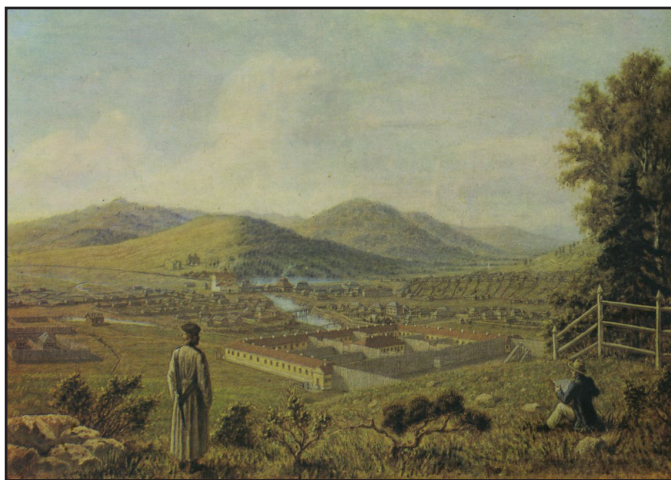
В. В. Давыдов. Вид Петровского завода. 1870. Копия с акварели Н. А. Бестужева 1834.