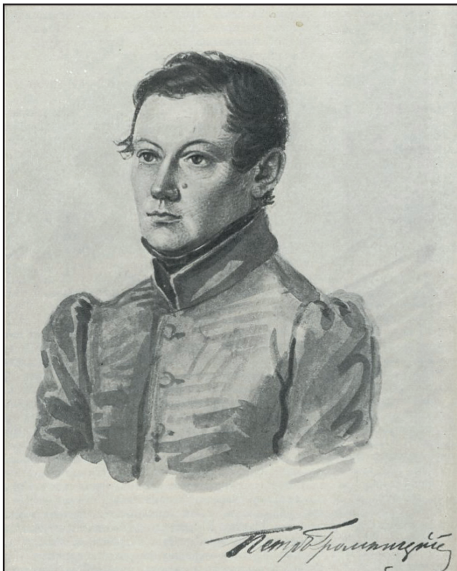
Н. А. Бестужев. П. Ф. Громницкий. 1836.