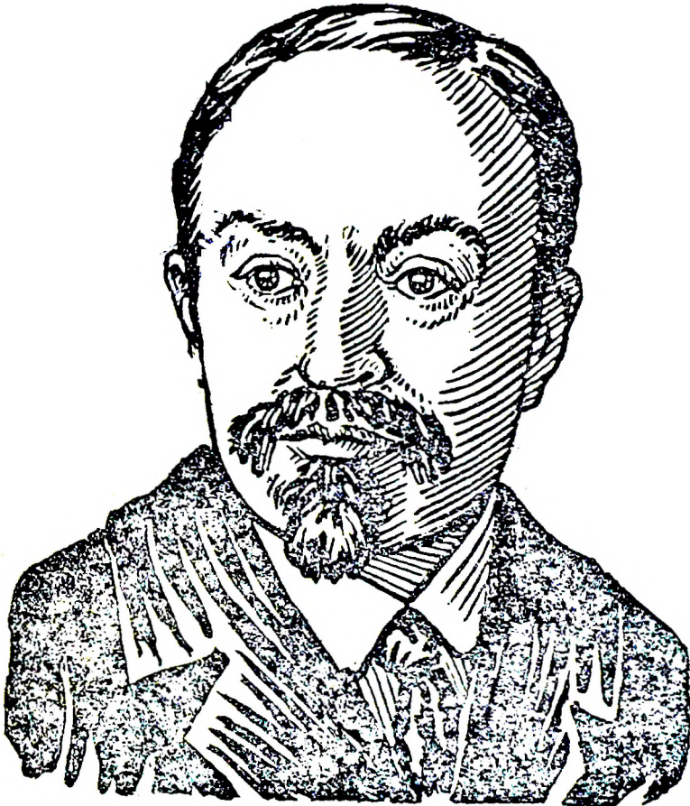
Георгий Валентинович Чичерин.

Адрес редакции журнала: Пенза, Губком РКП (б.), п/о печати.