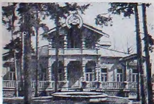
Музей народного творчества.

Поднявшийся на солнечном пригорке, окруженный столетним парком, дом этот дорог нам как редкий памятник деревянной архитектуры, как свидетельство необыкновенного мастерства русских умельцев, создавших и украсивших его.