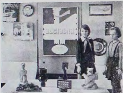
Выставка «Народные художественные промыслы» — сувениры для серийного производства (предприятия управления местной промышленности).