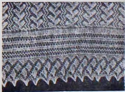
Пуховый платок. «Дубовый листок» — традиционный узор местных мастериц.

В постановлении ЦК КПСС «О народных художественных промыслах» (1975 г.), определившем дальнейшее их развитие, отмечается: «Народное декоративно-прикладное искусство, являющееся неотъемлемой частью советской социалистической культуры, активно